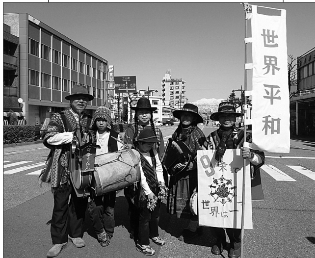
←9条ちんどんの仲間と。口上「ご近所のみなさん、世界のみなさん、おなじみの9条屋でございます。創業●年（●のところに憲法9条が成立してからの年数を入れる）、ご不要になりました争い事、もめ事がございましたらご用命ください。9条印の平和とお取替えいたします。みなさ～ん、9条屋をお忘れなく～」これで、素人ちんどんコンクールに出て奨励賞をもらったことがあるそうです。

このような活動ができるのは、インターネットによるところが大きいと言えますね。環境活動を支援するためにインターネットを通して世界とつながっていることに加え、日米環境活動支援センターのアドバイザーお